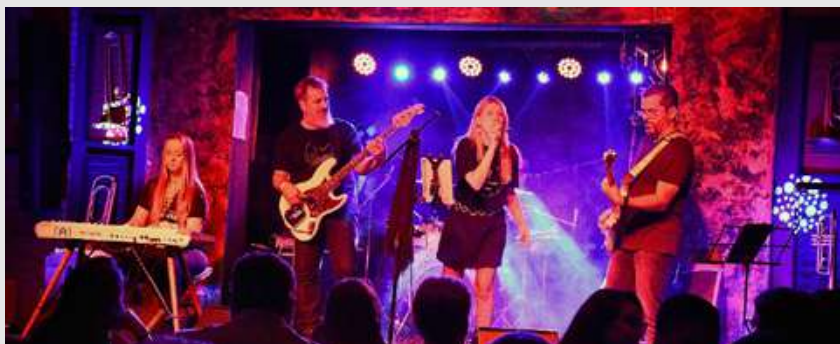
Palco da Showtime

A casa se destaca pela música ao vivo, shows, drinks, diversão, gastronomia e um público cheio de energia.