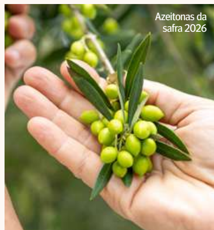
Azeitonas da safra 2026

Com a colheita ainda em andamento, a expectativa é que os azeites da safra 2026 cheguem ao mercado a partir de maio. ■