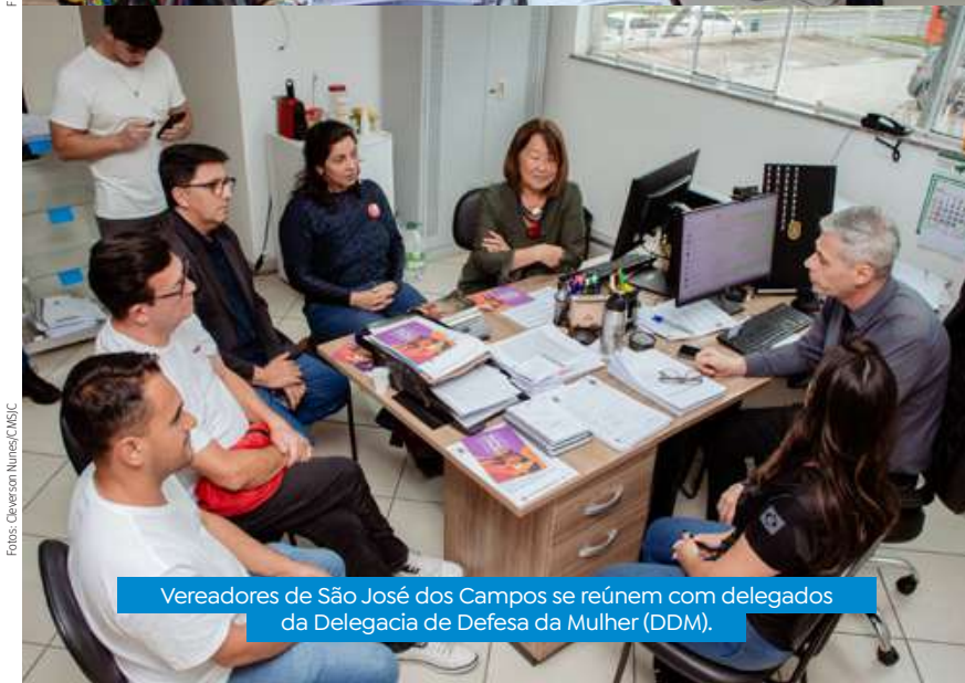
Vereadores de São José dos Campos se reúnem com delegados da Delegacia de Defesa da Mulher (DDM).